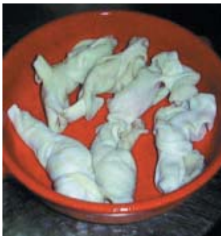
Nodi di trippa

Le materie prime sono: pezzi di trippa di agnello, aglio, prezzemolo, pomodoro,